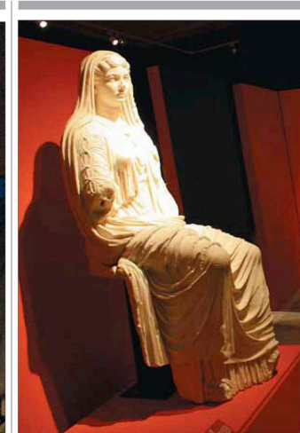
Escultura de Livia, tercera esposa d'August i mare de Tiberi, representada com una Juno capitolina

Una exposició d'escultura clàssica mostra detalls com els hàbits de perruqueria