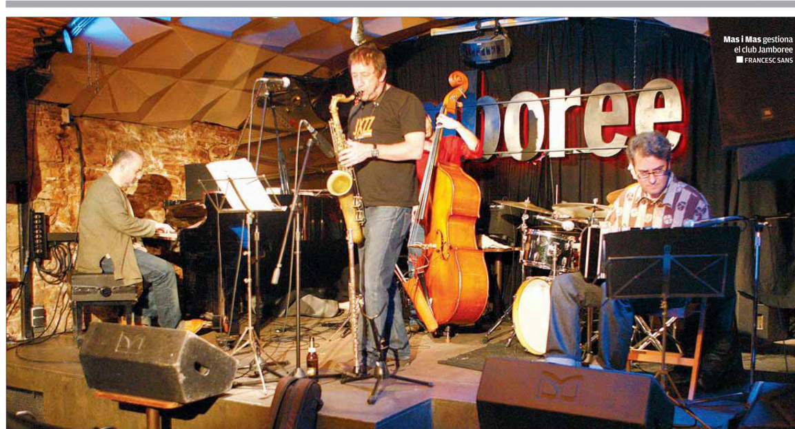
Mas i Mas gestiona el club Jamboree